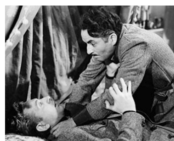
1943 ADIEU LÉONARD de Pierre Prévert avec Charles Trénet