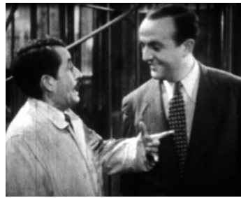
1945 MESSIEURS LUDOVIC de Jean-Paul Le Chanois avec Bernard Blier