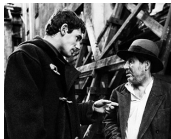
1956 CRIME ET CHÂTIMENT de Georges Lampin avec Robert Hossein