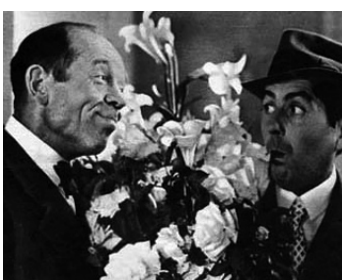
1941 FROMONT JEUNE ET RISLER AÎNÉ de Léon Mathot avec Pierre Larquey