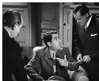
1939 TEMPÊTE de Bernard-Deschamps avec André Luguet