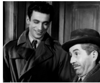
1946 LES PORTES DE LA NUIT de Marcel Carné avec Yves Montand