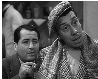
1937 LES ROIS DU SPORT de Pierre Colombier avec Fernandel