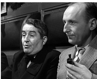
1958 LE MIROIR À DEUX FACES d'André Cayatte avec Bourvil