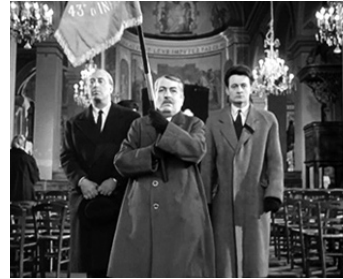
1953 LE BON DIEU SANS CONFESSION de Claude Autant-Lara avec Grégoire Aslan, Claude Laydu