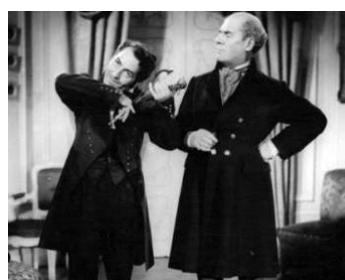
1942 LETTRES D'AMOUR de Claude Autant-Lara avec André Alerme