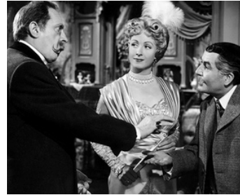
1949 OCCUPE-TOI D'AMÉLIE de Claude Autant-Lara avec André Lefaur, Danielle Darrieux