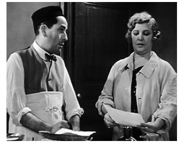
1935 FERDINAND LE NOCEUR de René Sti avec Jane Marken