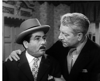
1950 POUR L'AMOUR DU CIEL (È piu facile che un cammello) de L. Zampa avec Jean Gabin