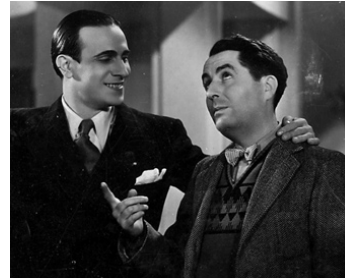
1936 MARINELLA de Pierre Caron avec Tino Rossi