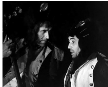
1937 LA MARSEILLAISE de Jean Renoir avec Gaston Modot