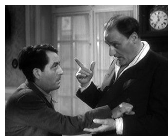
1939 BATTEMENT DE CŒUR d'Henri Decoin avec Saturnin Fabre