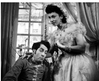
1939 LA RÈGLE DU JEU de Pierre Renoir avec Mila Parély