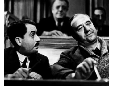
1937 GRIBOUILLE de Marc Allégret avec Raimu