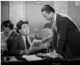
1938 ENTRÉE DES ARTISTES de Marc Allégret avec Claude Dauphin