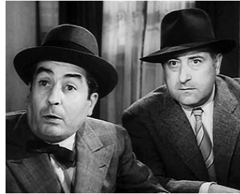
1952 LA FÊTE À HENRIETTE de Julien Duvivier avec Philippe Olive