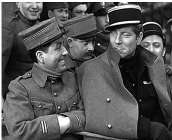
1937 LA GRANDE ILLUSION de Jean Renoir avec Jean Gabin