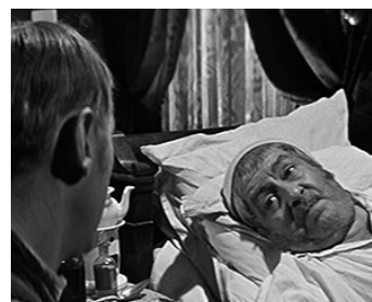
1959 LA JUMENT VERTE de Claude Autant-Lara avec Bourvil