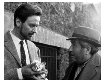
1963 LES AVENTURES DE SALAVIN de Pierre Granier-Deferre avec Maurice Biraud