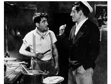
1938 LE RÉCIT DE CORAIL de Maurice Gleize avec Jean Gabin