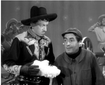
1949 BRANQUIGNOLS de Robert Dhéry avec Robert Dhéry