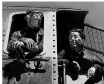
1938 LA BÊTE HUMAINE de Jean Renoir avec Jean Gabin