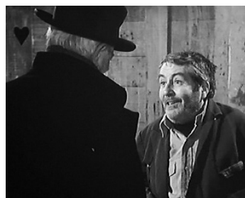
1958 ARCHIMÈDE LE CLOCHARD de Gilles Grangier avec Jean Gabin