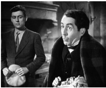
1945 SYLVIE ET LE FANTÔME de Claude Autant-Lara avec François Périer