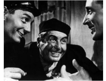
1953 L'AMOUR D'UNE FEMME de Jean Grémillon avec Roland Lesaffre, Massimo Girotti