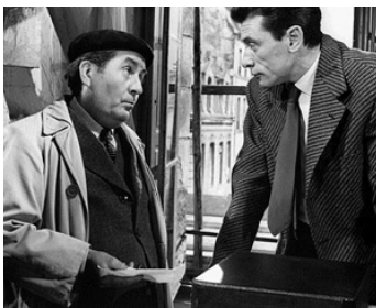
1955 RENCONTRES À PARIS de Georges Lampin avec Robert Lamoureux