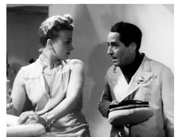
1941 CROISIÈRES SIDÉRALES d'André Zwoboda avec Madeleine Sologne