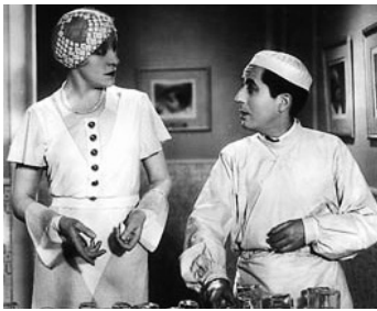
1932 LA POUPONNIÈRE de Jean Boyer avec Françoise Rosay