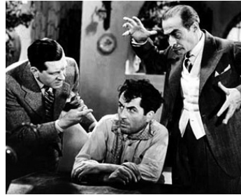
1935 PARIS-CAMARGUE de Jack Forrester avec Albert Préjean, Max Dearly