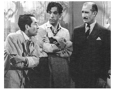
1946 HISTOIRE DE CHANTER de Gilles Grangier avec Luis Mariano, Noël Roquevert