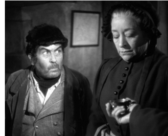
1951 L'AUBERGE ROUGE de Claude Autant-Lara avec Françoise Rosay