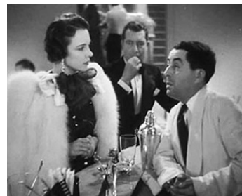
1938 L'ACCROCHE-CŒUR de Pierre Caron avec Jacqueline Delubac