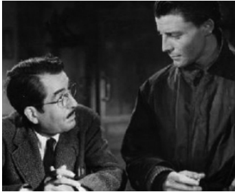
1948 UNE SI JOLIE PETITE PLAGE d'Yves Allégret avec Gérard Philipe